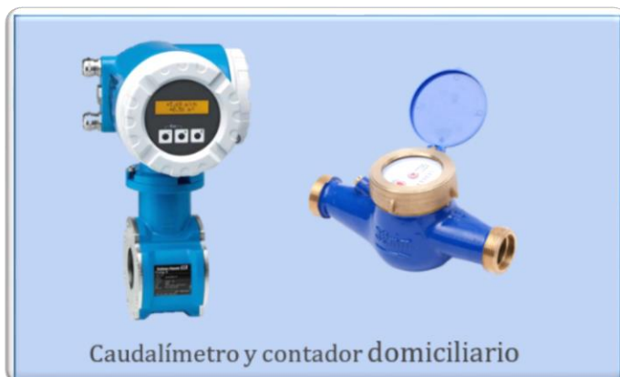
Caudalímetro y contador domiciliario

Para asegurar el flujo de agua constante y por lo tanto una mayor confiabilidad del abastecimiento, las redes de distribución son malladas , es decir forman ramificaciones y no anillos.