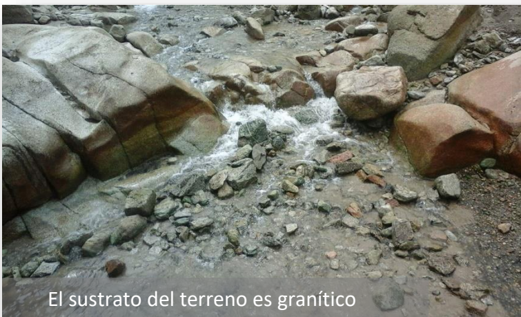
El sustrato del terreno es granítico

Hay que destacar que en periodos estivales de gran consumo también, como captación extraordinaria existe la Presa de Puente Alta, en Revenga. Desde allí hay otro transporte de agua hasta los Depósitos de Puente Alta que por gravedad llegará hasta nuestra ETAP donde se tratará adecuadamente.